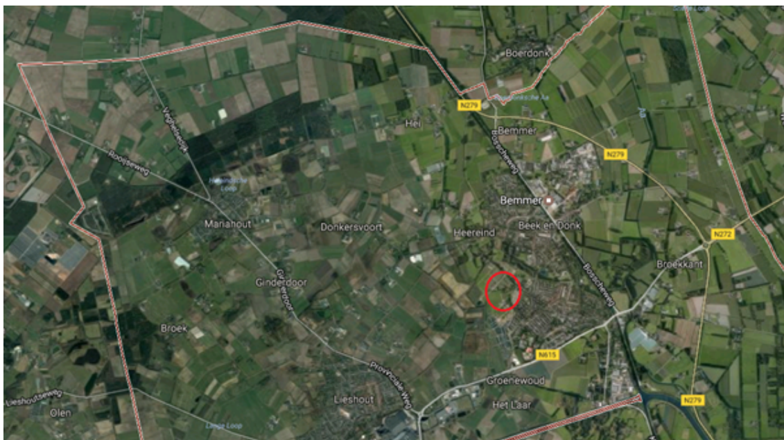
Figuur 1.1 Globale ligging plangebied in gemeente Laarbeek (plan gebied met rood omcirkeld)