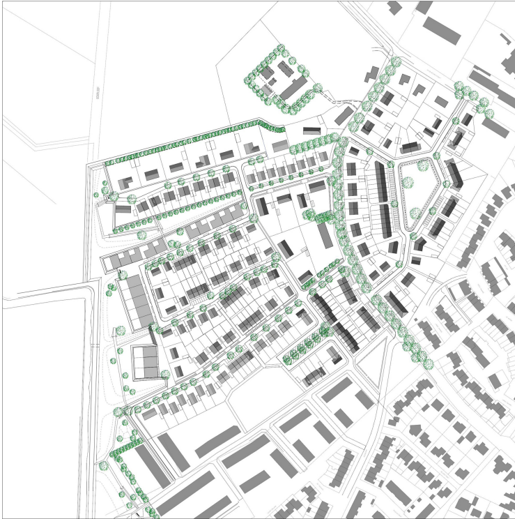
Figuur 3.1 Oorspronkelijke verkaveling