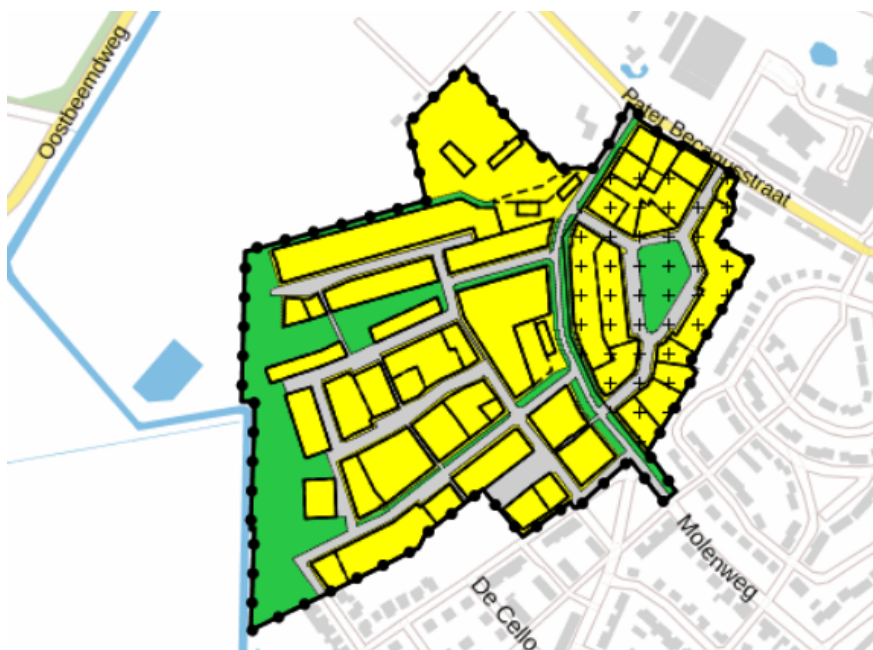
Figuur 1.2 Uitsnede verbeelding vigerende bestemmingsplan "Laarsche Velden Noord"