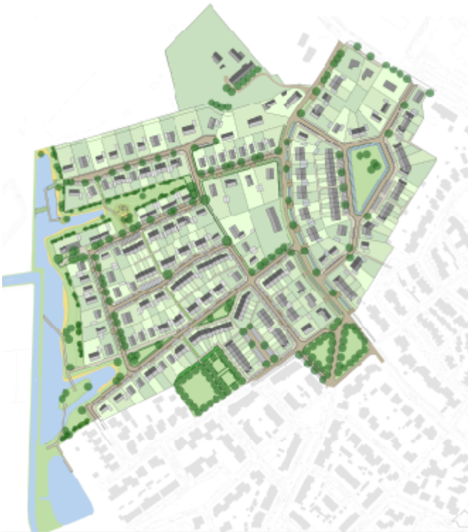
Figuur 3.2 De nieuwe verkaveling